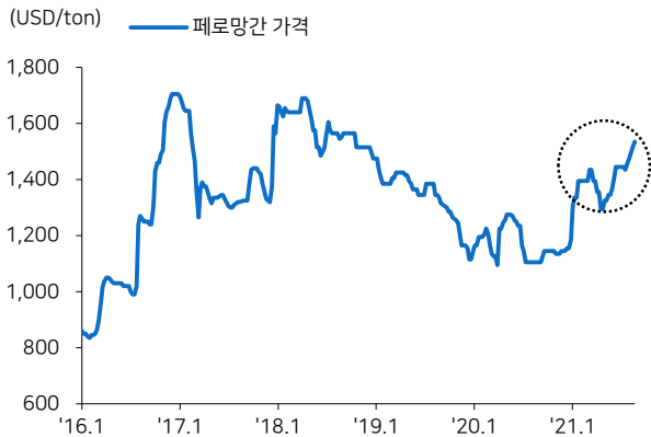
그림3 페로망간 가격 추이

주: 중국의 수출 가격 기준 자료: 자원정보서비스, 메리츠증권 리서치센터