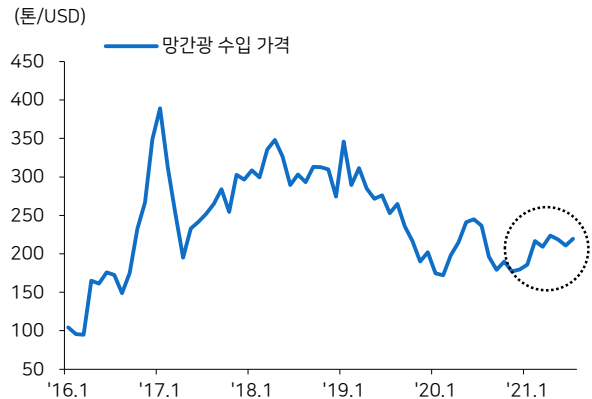
그림4 망간 광석 수입 가격 추이

주: 중국의 수출 가격 기준 자료: 자원정보서비스, 메리츠증권 리서치센터