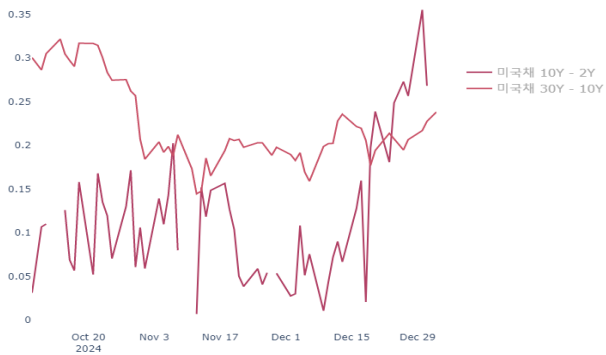
국채 10Y-3Y 및 30-10Y 커브 추이