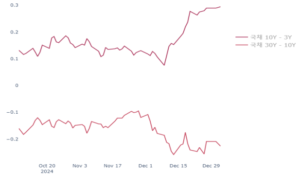
한-미 10년 및 30년 스프레드 추이