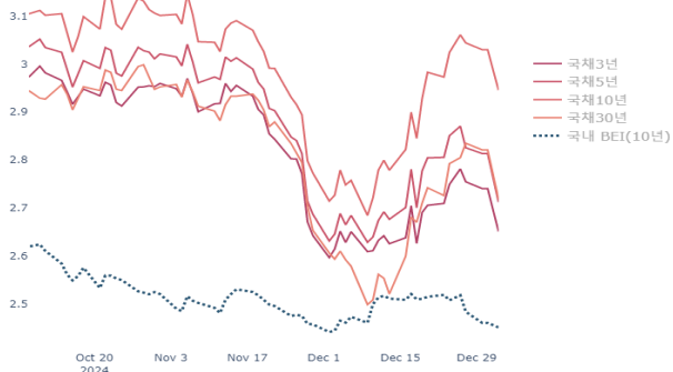
국채 3·5·10·30년 및 10년 BEI 추이