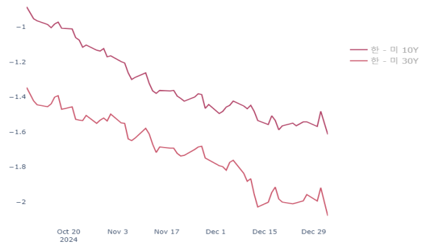
미국채 10Y-2Y 및 30-10Y 커브 추이