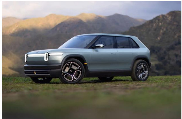
그림3 Rivian R3