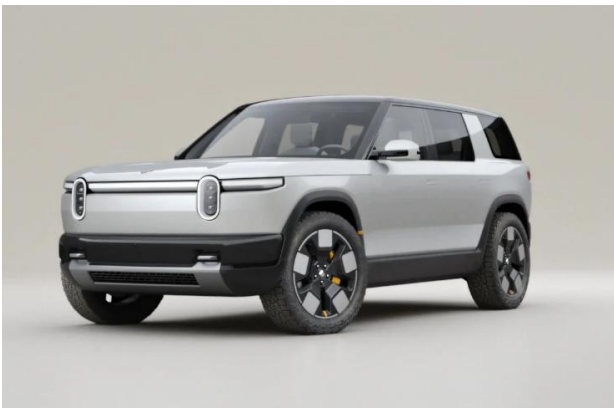
그림2 Rivian R2